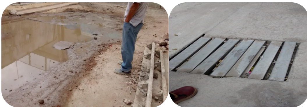
i- Fotografías tomada el 15/04/2015 en recorrida con la Junta Vecinal del Barrio Los Piletones.

En Los Piletones las inundaciones siguen siendo frecuentes, aun cuando no llueve. Parte del asfaltado avanzó sobre los viejos drenajes de las calles y los nuevos se encuentran tapados de basura que no es recolectada, generando que las cloacas desborden y exploten las rejillas que las contienen. Las manzanas más afectadas tienen que convivir con desechos en las puertas de sus casas, así como con la formación de “lagos” -como los vecinos los denominan- que cortan la circulación de las calles.