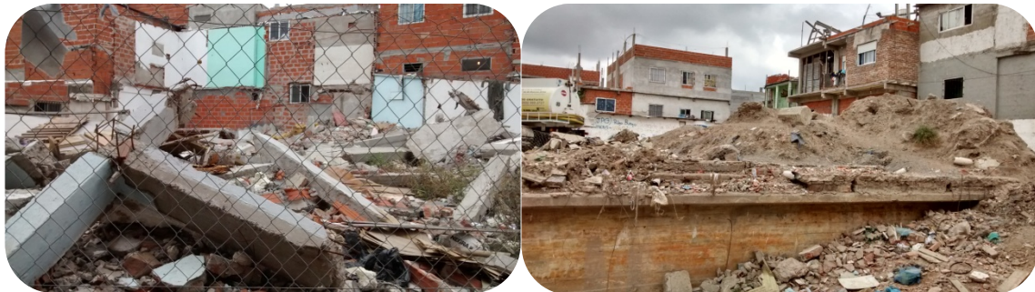
iii- Fotografías tomada el 15/04/2015 en recorrida con la Junta Vecinal del Barrio Los Piletones.

En cuanto a la recolección de escombros y basura, el servicio no es regular, por lo que hay basureros improvisados sobre los trazados de las calles. Tampoco han sido recolectadas las ruinas de las casas que se han demolido, dejando grandes espacios clausurados, cortando la circulación normal por los pasillos y proliferando la acumulación de basura. Tampoco se planteó desde el Gobierno -y mucho menos junto con la participación de los vecinos- qué es lo que se hará en los lugares que quedaron vacíos.