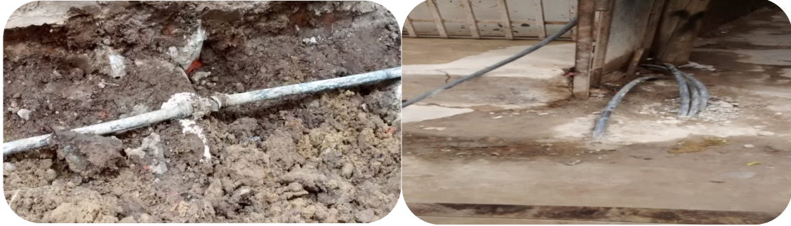
ii- Fotografías tomada el 15/04/2015 en recorrida con la Junta Vecinal del Barrio Los Piletones.

Las prestaciones de gas siguen siendo deficitarias. Tan solo una manzana cuenta con conexiones de gas natural. El resto, debe convivir con garrafas o conexiones caseras que presentan un potencial peligro para la vida de los vecinos.